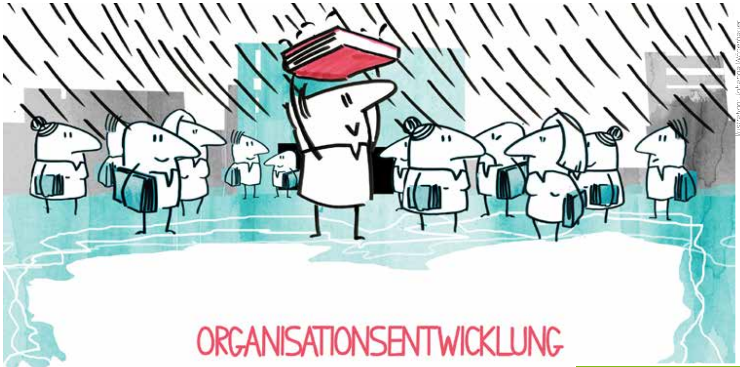
Illustration: Johanna Wöberbauer www.dailysketch.net